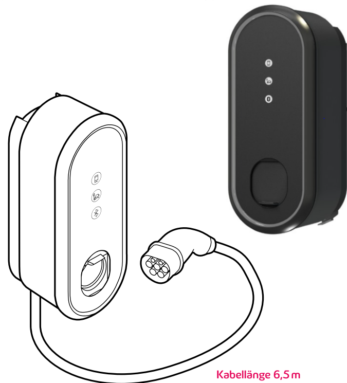
eBox smart mit Typ-2-Stecker mit Kabel