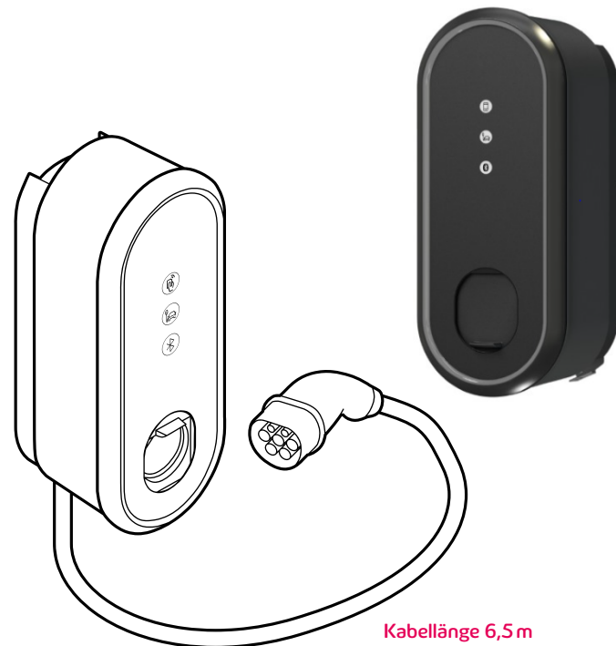
eBox professional mit Typ-2-Stecker mit Kabel